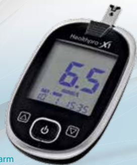
Blutzuckermessgerät Healthpro-X1 von Axapharm