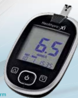
Glycomètre Healthpro-X1 d'Axapharm